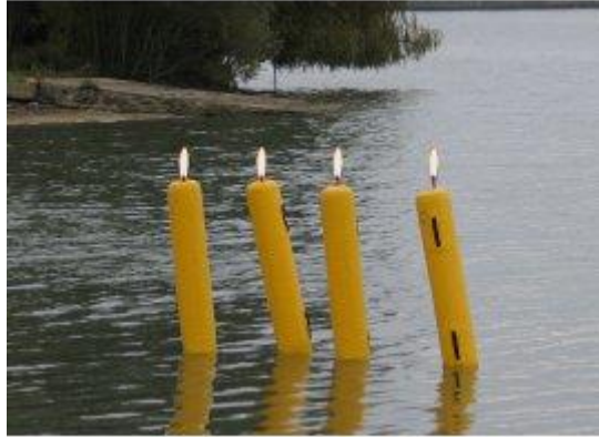
Manifestation de bouées jaunes

Les derniers rassemblements de « Bouées Jaunes » (4 selon le Jury, 500 selon les manifestants) n'a pas empêché le tournage de la célèbre série CF (« Coucou les Friends » - genre de « Friends » version aquatique !), sur le nom moins célèbre plateau de la Mare.